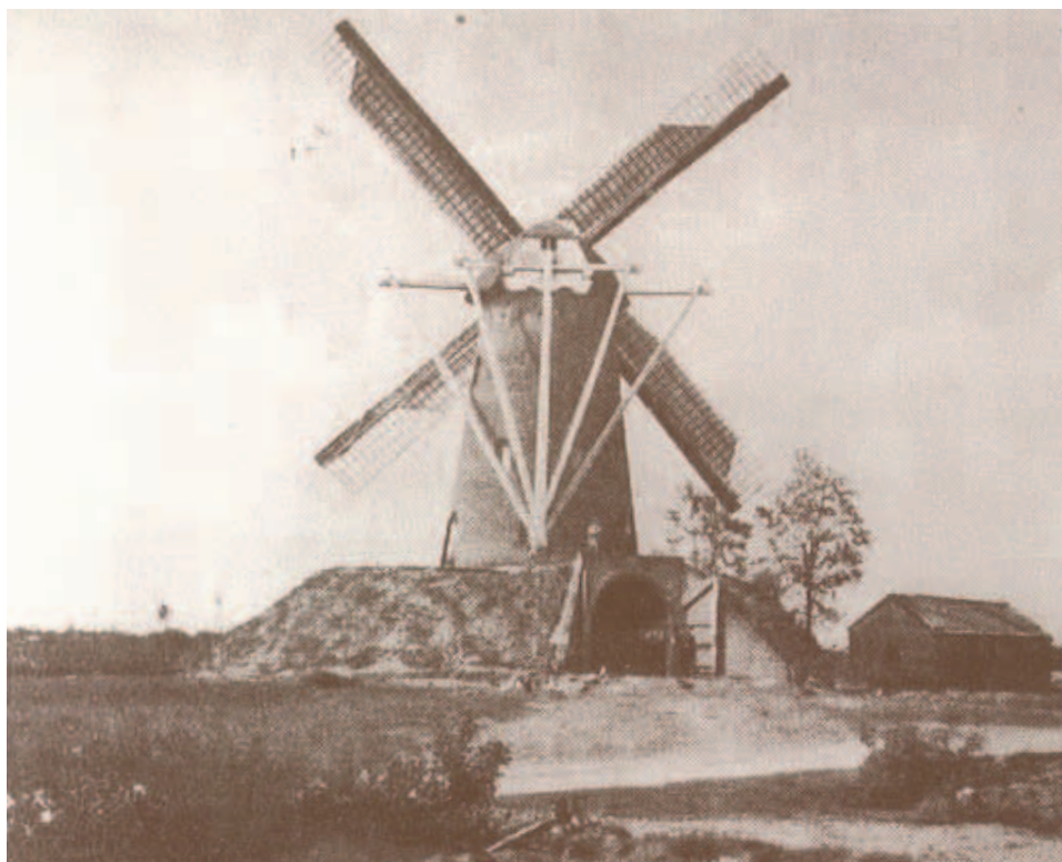
De molen aan de zuidzijde van de Gerwenseweg in Stiphout, werd in 1906 gebouwd. Na slechts dertig dienstjaren werd hij buiten werking gesteld.