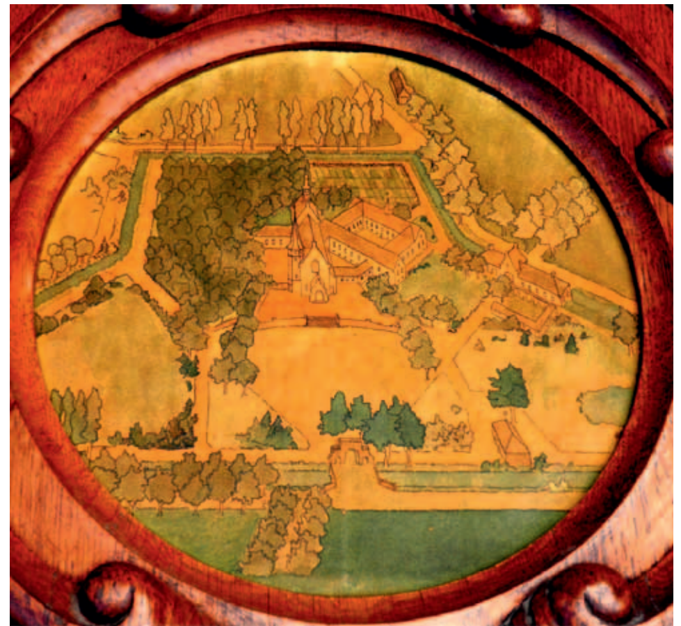
De tekening van Binderen zoals het er uit had moeten zien, gemaakt door Jan Magis.

Er was in Helmond een Stichting Onze Lieve Vrouw van Binderen opgericht met het doel om op de oude abdijgrond de Mariaverering te herstellen. Wederopbouw van de oude Maria-abdij voor zusters die daar in altijd durende aanbidding van het Heilig Sacrament gingen