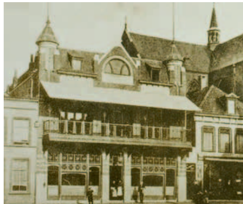
Sociëteit Gezelligheid was oorspronkelijk gevestigd in de Korenbeurs, gelegen op de Markt tussen Ameidestraat en Kerkstraat.

Sociëteit Gezelligheid werd in 1871 gesticht. Uit het eerste reglement blijkt dat het een voortzetting was van een toen reeds bestaande sociëteit die zetelde in de Korenbeurs. De club ontstond uit de onvrede onder protestantse fabrikanten die zich afzetten tegen het toenmalige