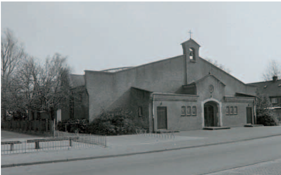
De noodkerk aan de Abdijslaan kort na haar inwijding in 1957.

elkaar waren, kwamen op 20 juni 1957 voor Binderen in actie. Zij streden in een voetbalwedstrijd op het Mulo-terrein om de titel 'Kampioen van de Wal'. Het elftal van de krantenmensen zegevierde met 2-1 en nam de titel mee naar het bedrijf. De entreegelden ten bedrage van 157 gulden, gingen naar de kerk van Binderen.