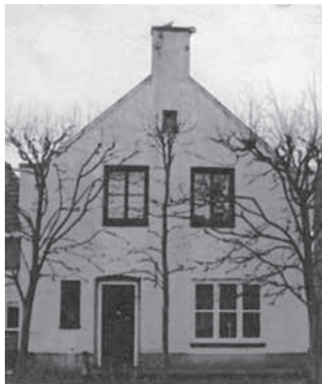
Boven de oorspronkelijke bouwtekening van het pand, onder de huidige situatie.

in 1840, toen Helena eigenaresse was van de grond, hoefde er geen cijns meer betaald te worden omdat het systeem van de cijnzen eind 18e eeuw, tijdens de Franse overheersing werd afgeschaft. De administratie van de cijnzen is in enkele