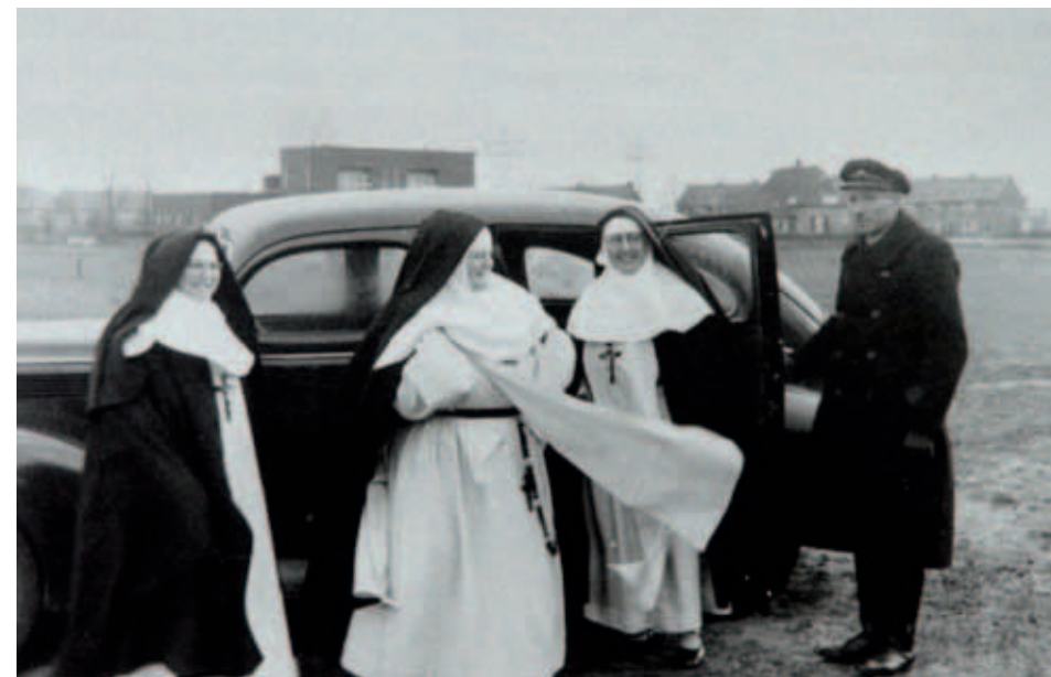
Het vertrek van de zusters in 1949. Ze zijn, zo te zien, erg opgelucht.

voogdiggesticht op te richten. De zusters vonden hun taak meer op dat gebied liggen. Dat was echter tegen de oorspronkelijke bedoelingen en afspraken in. De stichting zag evenals vele anderen in Helmond op Binderen liever een meer contemplatieve orde gevestigd om er de abdijsgedachte beter tot uiting te laten komen. Toen de tegenstellingen groeiden verzochten de zusters uiteindelijk om de vestiging in Helmond te mogen opheffen. Daarvoor kregen ze van de stichting toestemming, maar de bisschop van Den Bosch wilde dat ze nog enige tijd zouden blijven. Aan dat verzoek gaven ze geen gevolg. Hoe de verhoudingen intussen vertroebeld waren blijkt uit het feit dat de zusters op 30 juli 1949 zonder nadere kennisgeving aan het bestuur de sleutel van het tabernakel uit de Mariakapel achterlieten bij de bewoner van de naburige boerderij en