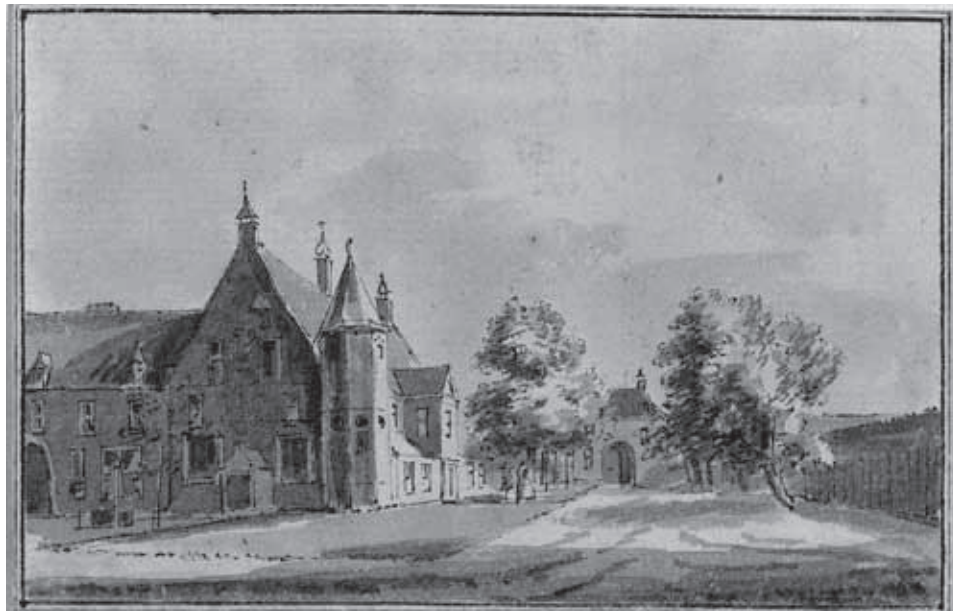
Klooster Binderen 1730, repro van een tekening van Hendrik Spilman naar Abraham de Haan. Op de zijmuur van het gebouw staat het jaartal 1597. Op de achtergrond is het poortgebouw te zien.

In de naburige H. Hartparochie klaagde men toch al over Binderen als 'de panter in de nek van het H. Hart' . Het verwijt dat deze anatomisch gezien nogal ingewikkelde beeldspraak inhield, kon toch niet verhinderen dat er uiteindelijk een kerk aan de Abdijlaan zou verrijzen. Omdat er dus eerst een voorlopige kerk