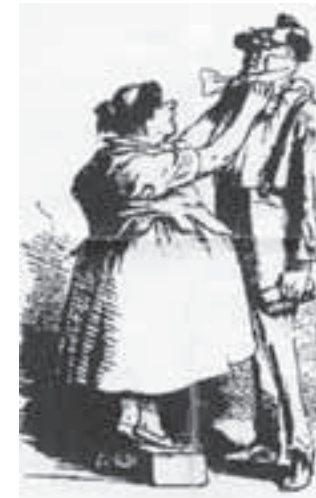
Doe je boordje goed. Vader moet als achtenswaardig sociëteitslid gekleed gaan.

De sociëteit had eertijds een chique karakter en was uitsluitend bestemd voor lieden met een hoog maatschappelijk aanzien. Toelating tot het gezelschap kon enkel worden verleend na een uitvoerige ballotage, waarbij aan de hand van opgestelde criteria onderzocht werd of