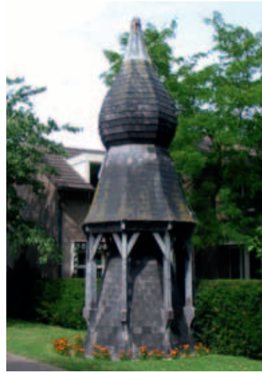
De fraai gevormde torenspits van de tweede Heilig Hartkerk ontsnapte aan de slopershamer. Sindsdien staat hij in een voortuin aan de Burgemeester Krollaan.