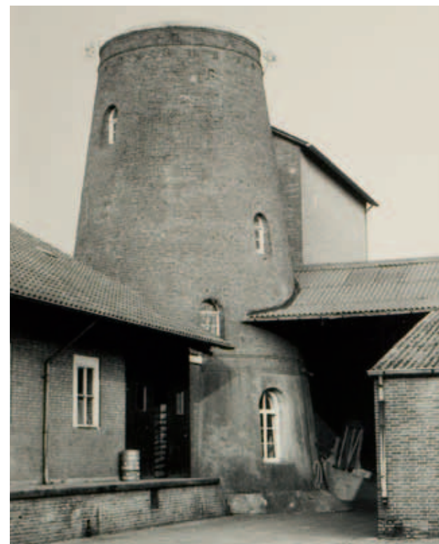
De romp diende nog lange tijd als opslagruimte voor de plaatselijke Boerenbond.