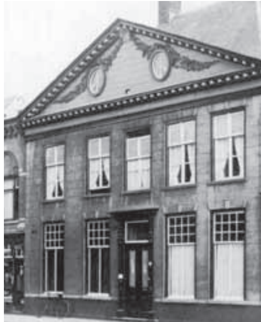
Sociëteit Gezelligheid aan de Pantoffelstraat.